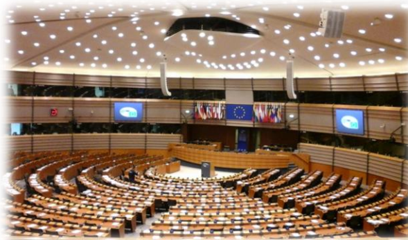
Vizitarea instituțiilor europene de la Bruxelles – septembrie 2015