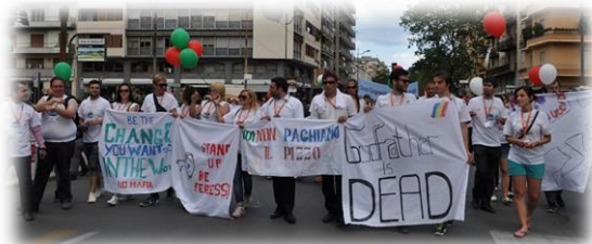
Palermo chiama Italia - zi dedicată comemorării victimelor Mafiei, demonstrație de stradă (23 mai 2015, Palermo)