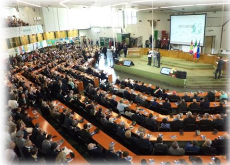
Palermo chiama Italia- Aula Bunker, mai 2015